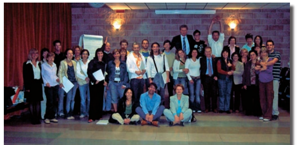
Corso D.M. e C. - Schio (VI)

Capita che nello scorrere delle giornate, qualsiasi cosa stia facendo, un pensiero inaspettato mi faccia visita... è un lampo, veloce come un riflesso di luce... mi fermo un istante e mi accorgo che sto sorridendo, è un saluto all'emozione di vivere questi attimi consapevoli di cambiamento.... il semplice meravigliarsi nel riconoscerlo.