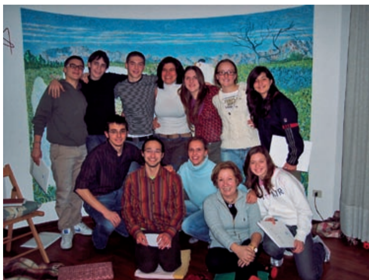
Corso D.M. e C. Adolescenti - Trieste