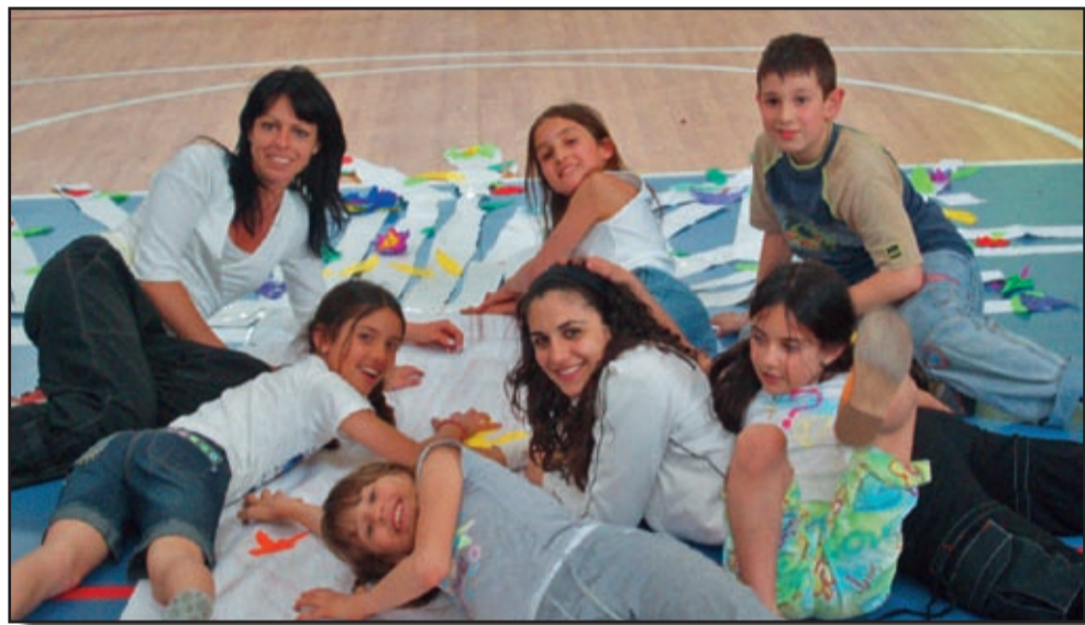
Corso bambini - Cassago (CO)