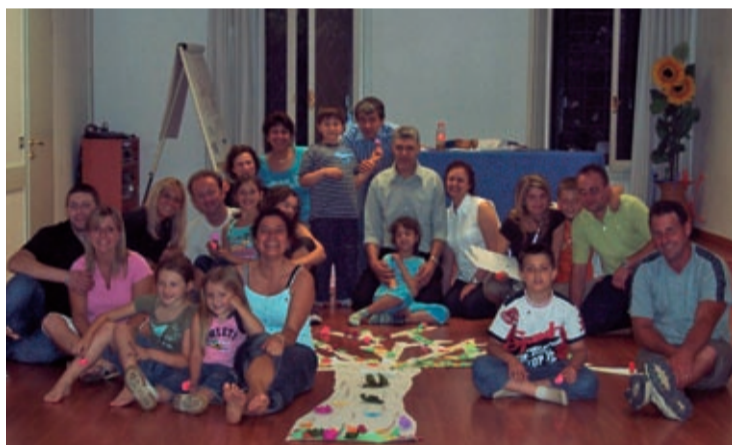
Corso Bambini - Vicenza