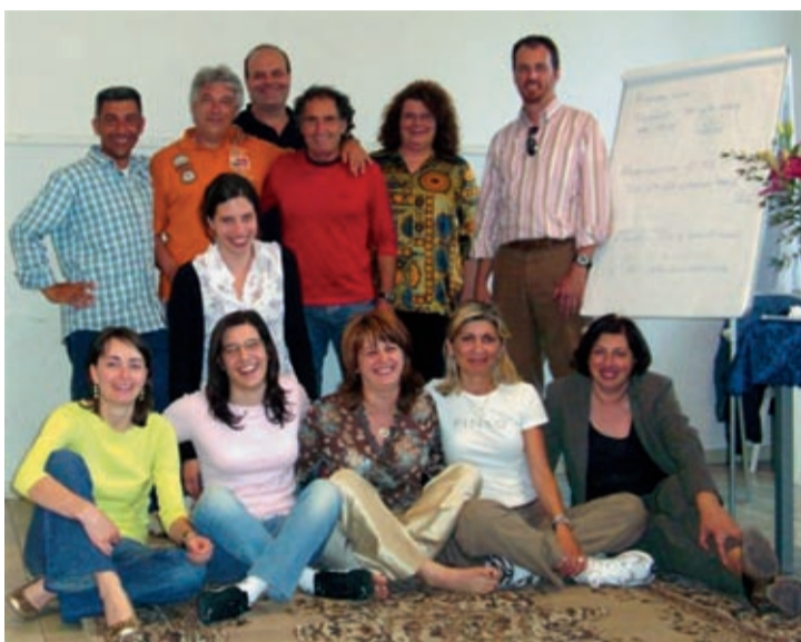
Corso D.M. e C. - Firenze