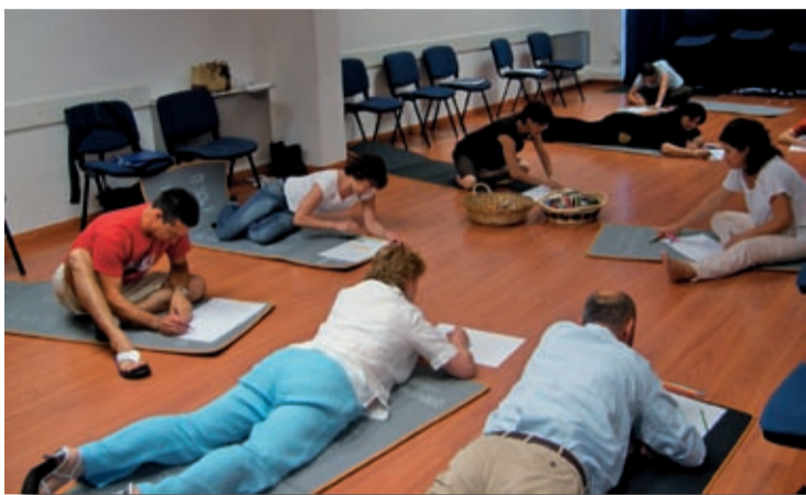
Corso Genitori - Vicenza