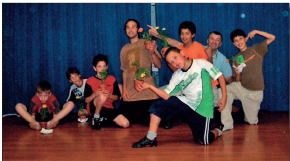
Corso Preadolescenti marzo 2007 di Vicenza