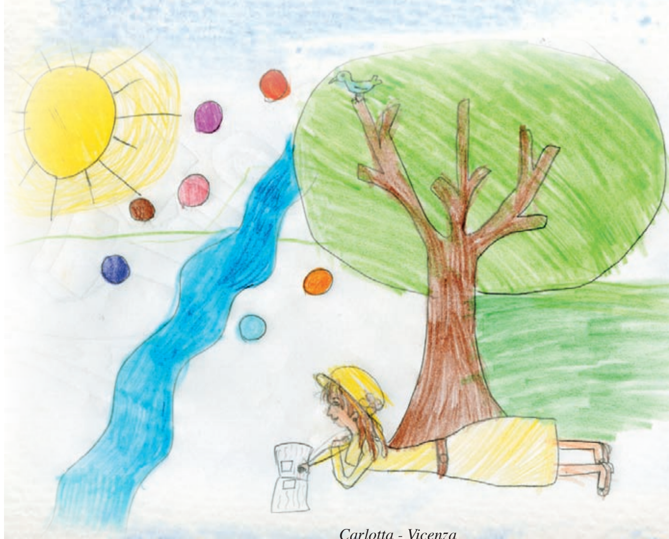
Carlotta - Vicenza