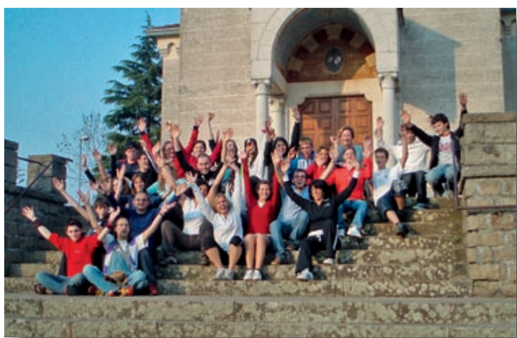
Corso D.M. e C. Adolescenti - Cerealto (VI)